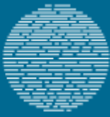
Εικόνα: Mind Map 02